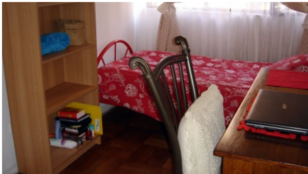
Zu vermietendes Zimmer