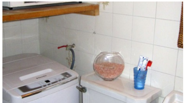
WC mit Waschmaschine und Trockner