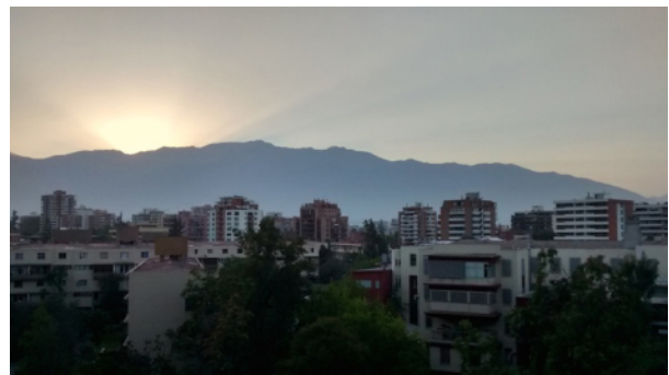
Aussicht aus dem Zimmer