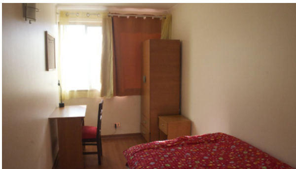
Zu vermietendes Zimmer