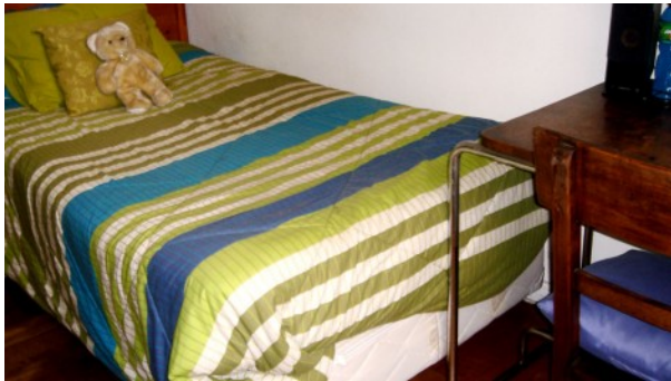
Zu vermietendes Zimmer