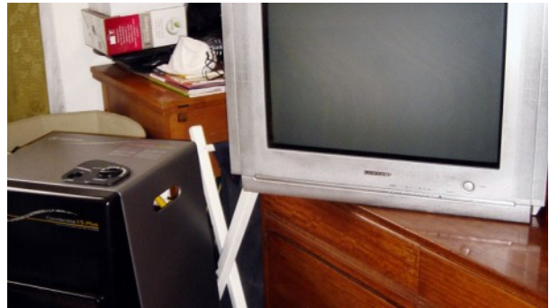
Fernseher und Heizkörper im Zimmer